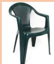
STOL IZ PLASTIKE