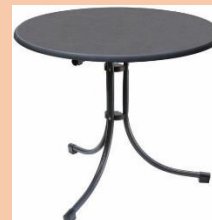
MIZA IZ KOVINE