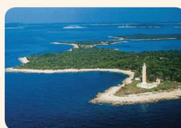
Obala Jadranskega morja

Jadransko morje je dolg in širok zaliv Sredozemskega morja, ki deli Apeninski polotok od Balkanskega polotoka. Njegova modrina je resnično utelešenje najboljših delov Sredozemlja. Bistrina na kopnem sega celo do 56 m. Globina morja na severu je okoli 50 m, medtem ko je pri Palagruži morje globoko do 250 m. Pri najbolj oddaljenem otoku Jabuka se globina spusti do 1.300 m. Povprečna temperatura morja je poleti od 22 do 27 stopinj Celzija, medtem ko je najnižja zimska temperatura 7, spomladi pa prijetnih 18 stopinj Celzija.